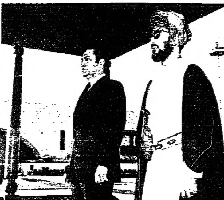
سمو السيد ثويتي بن شهاب وسيادة حصتي مبارك على منصة الشرف ثم الضيف المصري وهو يصافح كبار مستقبليه لدى وصوله الى المطار

واحد على اتباع اسلوب معين . سؤال : الفلسفة لما يتربد حول اتجاه لعقد مؤتمر قمة عربي شامل بعد تغير خطوات السلام نتيجة للتعنت الاسرائيلي مع تلافي الخلافات الجانبية او مؤتمر قمة محدود . ما هو موقف مصر من هذه الدعوة ؟ جواب : بالنسبة لمؤتمر القمة نحن نبحث عن حل للقضية ولا نبحث الان عن مؤتمر قمة تجلس فيه لتغيير الخلافات ، ولكي تتاح فرصة لدول الرضخ لاثارة المشاكل . حيثما نصل الى نهاية الشوار وحل شامل للقضية يمكن عندئذ دعوتهم للمقمة وتجلس سوية ، وننكلم ، وللرافضين ان يردوا علينا . سنقول لهم هذه ارضكم . . . وننتظر رددهم على ذلك . انما لا ارى في تقديري الشخصي ضرورة لمؤتمر قمة الان . ثم ما هو الجديد الذي يدعوننا للتفاوض .